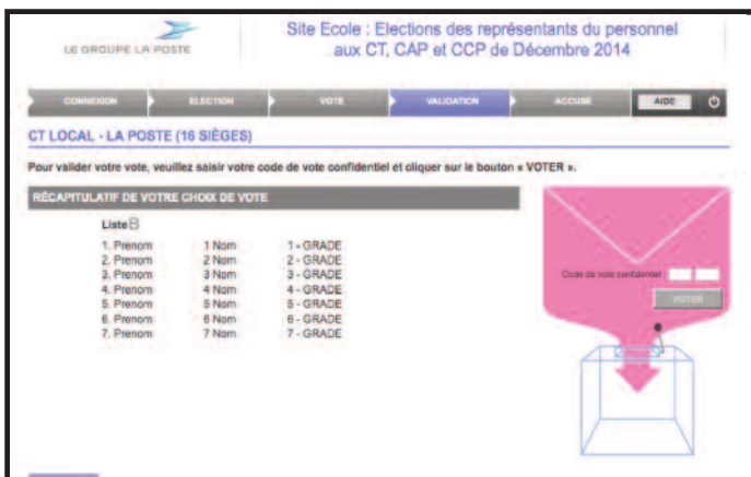
Etape 5 : InSCRIPTION du code confidentiel à 8 chiffres qui vous a été transmis, cliquer sur « voter ». Il faudra ressaisir ce code pour chacun des 4 scrutins.