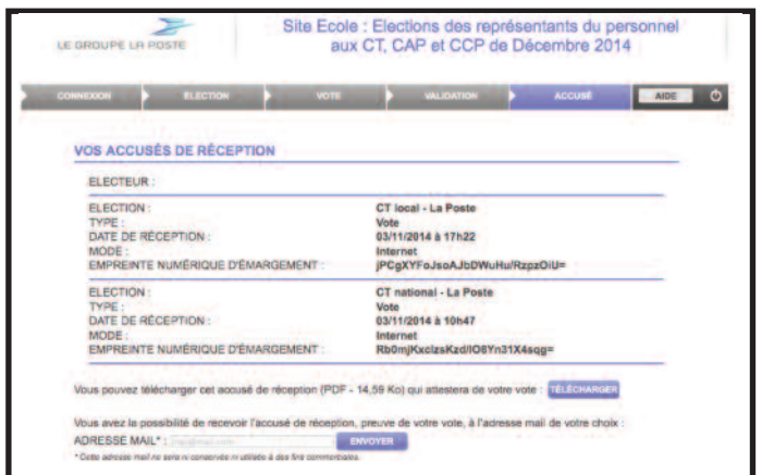
Etape 6 : Il sera possible d'éditer un accusé de réception du vote, sur place s'il y a une imprimante ou envoi sur une adresse mail. Sur cet exemple il y a eu deux votes, le CT national et le local.