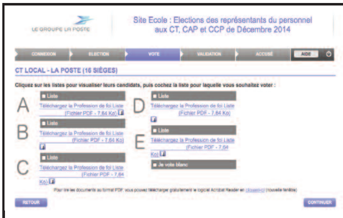
Etape 3 : C'est sur cet écran qu'il faudra choisir la liste pour qui voter. Les professions de foi y sont accessibles. Pour voter, cocher la case devant le nom de la liste.