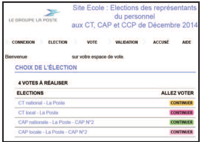
Etape 2 : choisir l'élection, il faudra en effet voter jusqu'à 4 fois, CT national et local, CAP ou CCP nationale et locale. On peut commencer par n'importe quel scrutin. Après chaque vote, on revient sur ce menu.